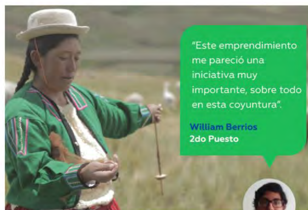
Emprendimiento "Mujeres Aymaras"